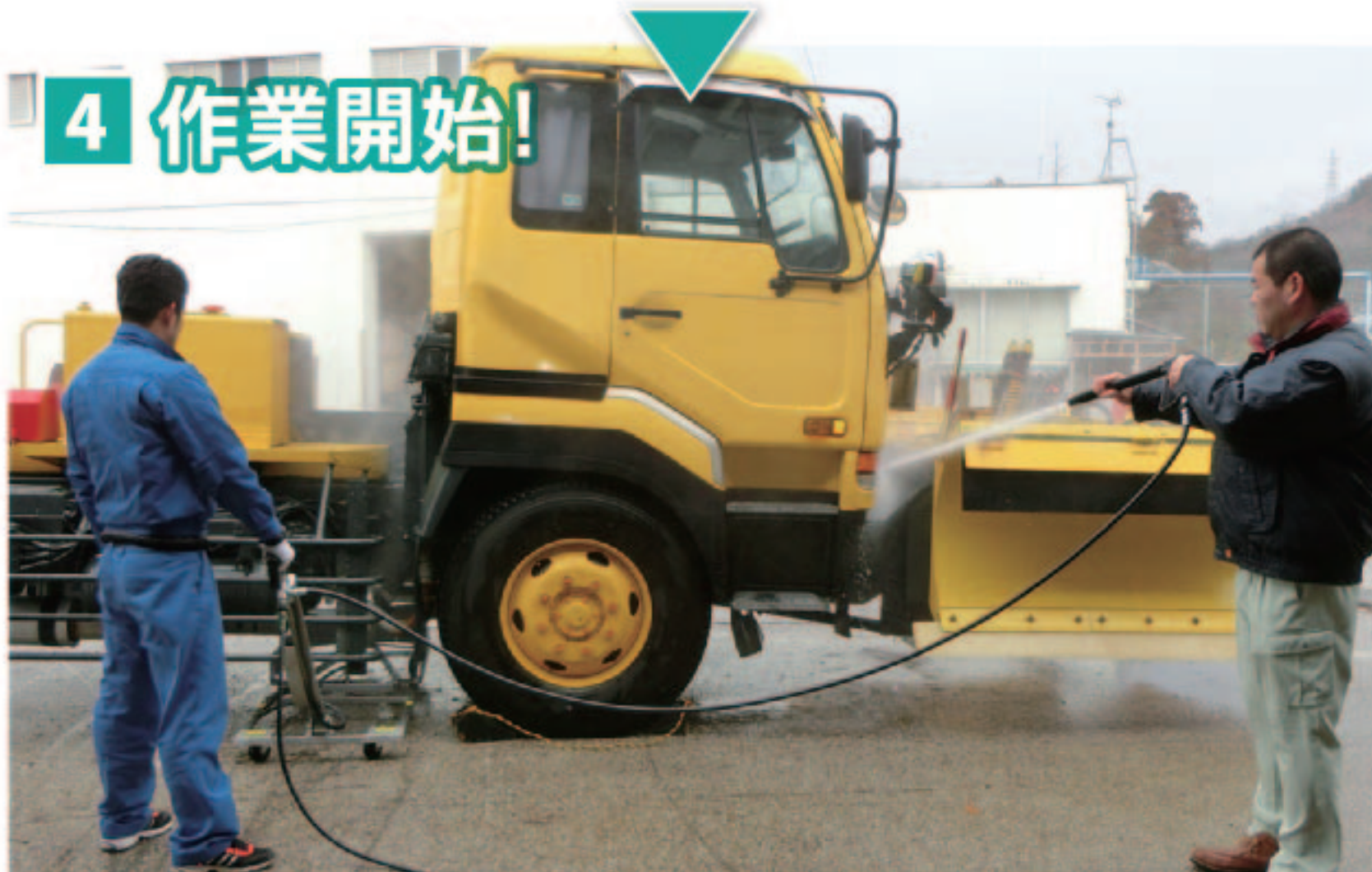
4 作業開始! ライフルガンもセットされていますので、2人で一度に作業をする事が出来ます。