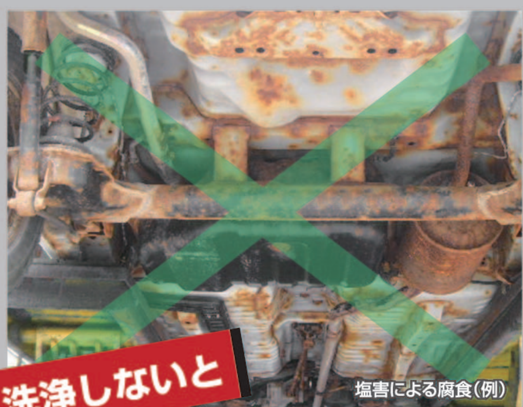
塩害による腐食(例)

洗浄作業はかがんだり 潜り込んで大変だった! 時間がかかり作業しにくい部分のため、これまでは大変な作業になっていた。