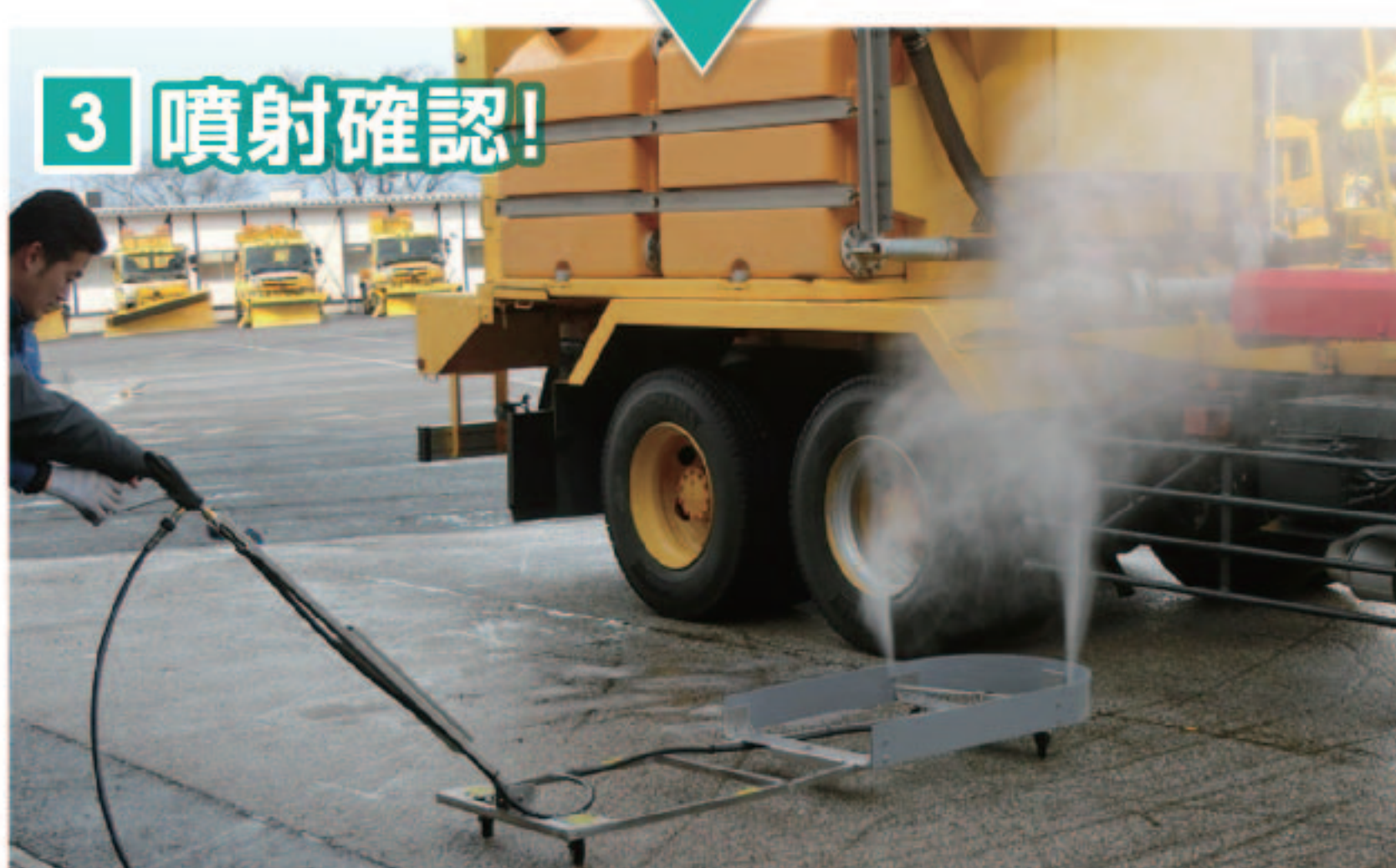
3 噴射確認! 噴射の確認をして手でコントロール底部の洗車が可能です。