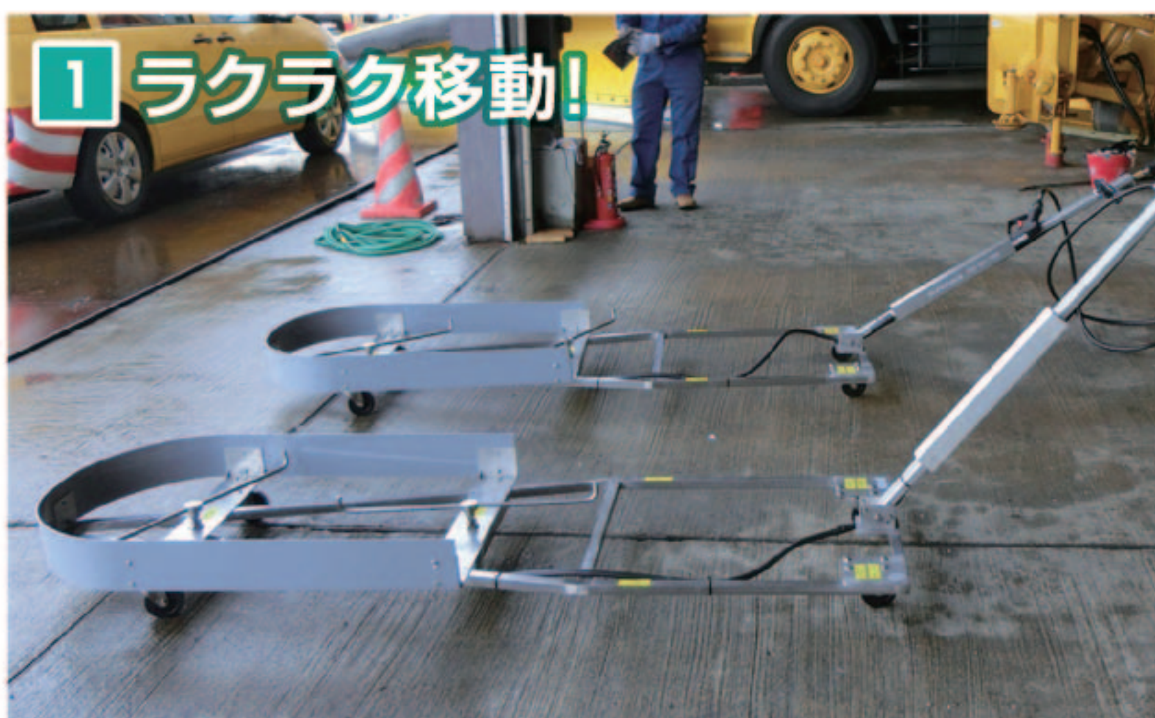
1 ラクラク移動! 軽量でキャスター付きタイプだから、ラクラク移動。