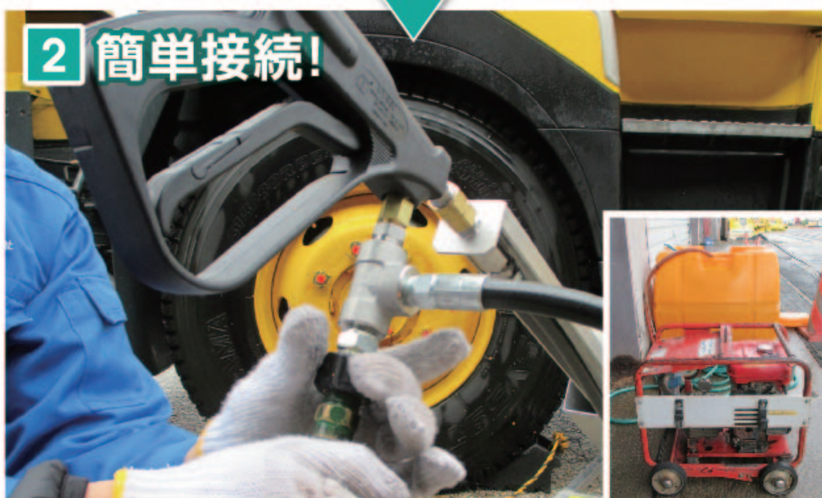
2 簡単接続! 今までの高圧洗浄機に接続して使えます。